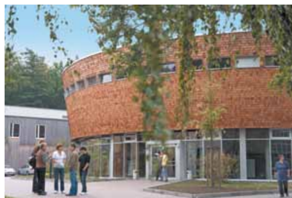
Hochschule für nachhaltige Entwicklung (FH) Eberswalde

» Eberswalde im Landkreis Barnim hat sich ein zukunftsweisendes Alleinstellungsmerkmal gegeben. Mit der „Null-Emissions-Strategie“ verbinden sich nachhaltige Energiegewinnung, Klimaschutz und regionale Arbeitsplatzsicherung. Das ist so genial wie praktisch, denn die Stadt kann so aus Traditionen schöpfen, die sie geschickt in richtungweisende Wirtschaftszweige einbeziehen kann. Energie- und Umwelttechnik ver-