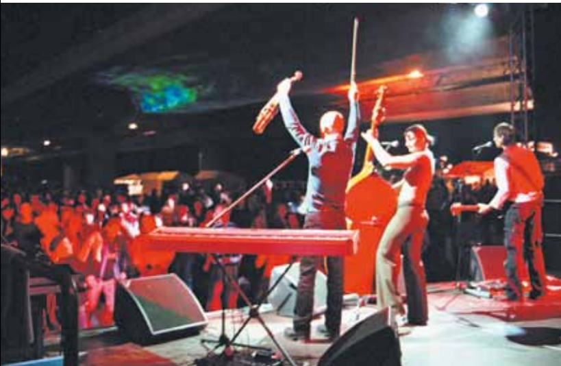
Kultur: Party beim Brückenfest