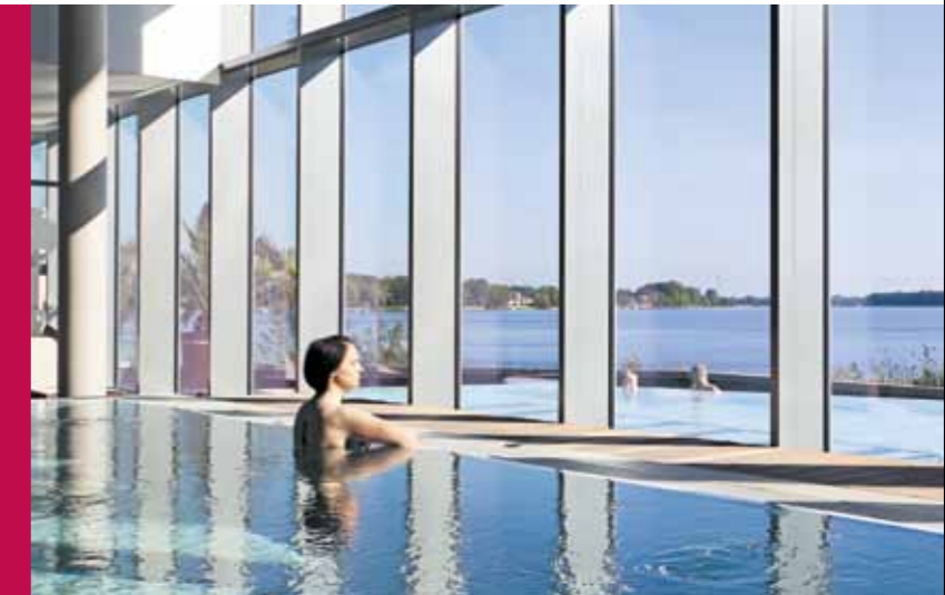
Erste zertifizierte Heilquelle im Land Brandenburg in der Fontanestadt Neuruppin

» Der Standort Neuruppin – als Regionaler Wachstumskern – ist das wirtschaftlich bedeutendste Zentrum im Nordwesten des Landes Brandenburg. Durch die verstärkte Zusammenarbeit mit den Nachbarkommunen (Stadt Rheinsberg, Gemeinde Fehrbellin, Ämter Temnitz und Lindow) hat der RWK ein Bevölkerungspotenzial von ca. 60.000 Einwohnern. In nur zwei Stunden Fahrzeit sind Hamburg und die Ostsee zu erreichen, nach Berlin benötigt man weniger als eine Stunde.