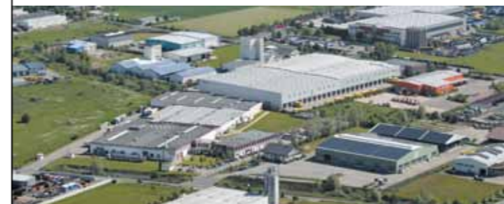
Industrie- und Gewerbegebiet Neuruppin Treskow

Wichtige Unternehmen (Auswahl) PAS Deutschland GmbH · ESE Expert GmbH · Atotech Deutschland GmbH · TES Frontdesign GmbH · HUCH GmbH Behälterbau · CABLO Metall-Recycling & Handel GmbH · GRIAG Glasrecycling AG · Euomar Commodities GmbH · Dreistern Konserven GmbH & Co. KG · Opitz Holzbau GmbH & Co. KG · Holzwerke Bullinger GmbH & Co. KG · Ruppiner Kliniken GmbH · Resort Mark Brandenburg