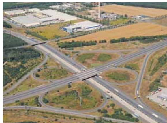
Gute Verkehrsanbindung: Ludwigsfelde zieht Unternehmen an.

Schon 1936 errichtete Daimler Benz hier ein Flugzeugmotorenwerk, in dem heute Mercedes-Transporter produziert werden. Ebenfalls setzt MTU am Standort Triebwerke instand und ThyssenKrupp Umformtechnik produziert Karosserieteile. Logistikzentren von Volkswagen und Siemens kamen hinzu. Die gute Verkehrsanbindung, auch zum Großflughafen BER in Schönefeld, zieht weitere Unternehmen an. Eine breitere Diversifizierung wird angestrebt. Metall und Ernährungswirtschaft sind weitere Kompetenzfelder, die bereits am Standort sind.