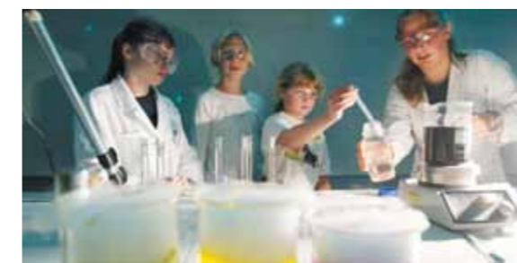
Experimentierende Kinder „Im Reich der Farbe“ an der Universität Potsdam

Ideenschmiede, Traumfabrik und Zukunftslabor: Die Stadt bietet jedem die Chance, an der Zukunft mitzuarbeiten. Mit einem Netz an branchenorientierten Technologie- und Gründerzentren, flankierenden Netzwerken sowie attraktiven Unterstützungsangeboten ist Potsdam das Zuhause von immer mehr Existenzgründern, wissensorientierten Start-Ups und innovativen Unternehmen. Kein Wunder also, dass Potsdam wächst und als Wohn- und Arbeitsort immer beliebter wird. Gute Ideen setzen sich eben durch.