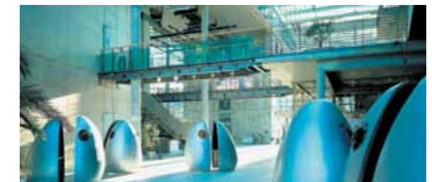
Hochschule für Film und Fernsehen (HFF), Innenansicht

Sechs Hochschulen, über dreißig außeruniversitäre Forschungseinrichtungen und rund 25.000 Studenten machen Potsdam heute zu einem Wissenschaftsstandort von nationaler und internationaler Bedeutung. Und längst ist Potsdam auch ein exponierter Wirtschaftsstandort mit hoher Dynamik. Im Zusammenspiel von Wissenschaft und Forschung sind Branchenkompetenzen entstanden, die der Stadt ein eigenes und zukunftsorientiertes Profil geben. Film- und Medienschaaffende zieht es nach Babelsberg, wo auf traditionsreichem Boden einer der modernsten europäischen Medienstandorte gewachsen ist. Unternehmen aus Life Science, Geoinformation und IT entwickeln hier neue Verfahren, Werkstoffe und Technologien.