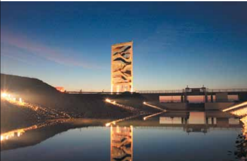
Landmarke Sornoer Kanal