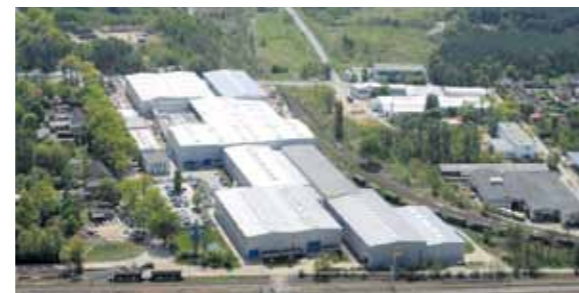
Züblin Stahlbau GmbH Senftenberg

Ein besonders interessantes Gewerbegebiet wird mit 96 Hektar GI-Fläche in unmittelbarer Nachbarschaft zur BASF Schwarzzeide, mit direktem Autobahnanschluss zur A 13 Berlin – Dresden angeboten.